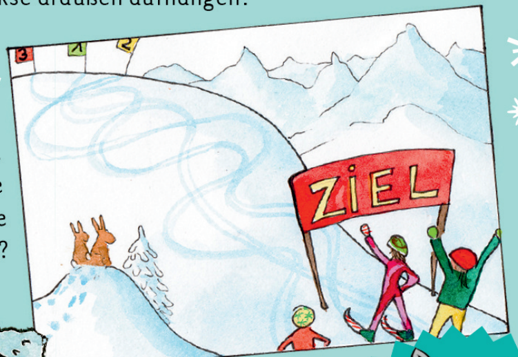
Der Skifahrer mit der Startnummer 1.

Rätsel: Wer ist im Rennen die kürzeste Strecke gefahren?